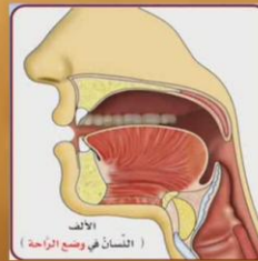
الياء (ارتفاع كامل لوسط اللسان)