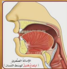
الإمالة الكبرى (ارتفاع كامل لوسط اللسان)