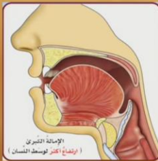
الإمالة الصغرى (ارتفاع قطر لوسط اللسان)